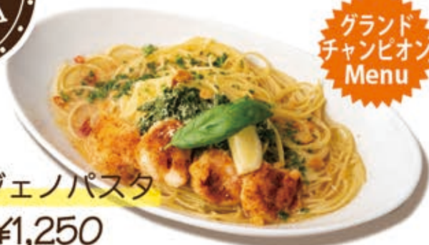
えびジェノパスタ ¥1,250