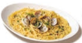
ボンゴレピアンコ