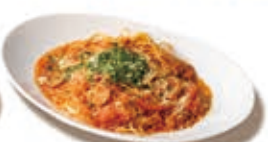
モッツアレラチーズのトマトパスタ ジェノベーゼのせ