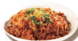
自家製ミートソースポロネーゼ