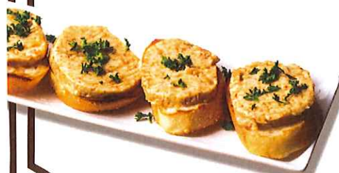
イチジクバターバケット4枚