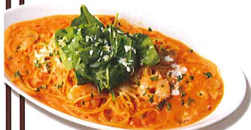
小えびとルッコラのトマトクリーム