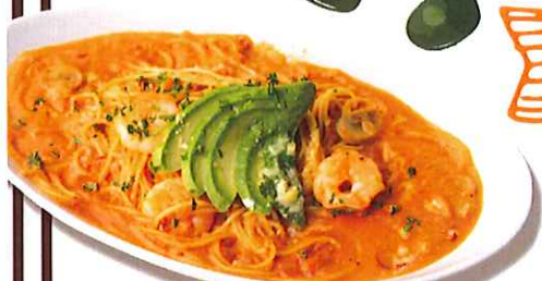
小えびとアボカドのトマトクリーム