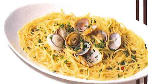
ボンゴレビアンコ