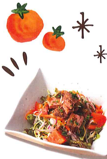
ごろごろローストビーフサラダ (ノンオイル)