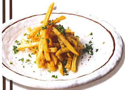
アンチョビフライドポテト