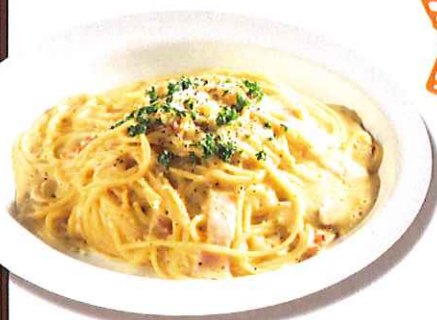
バンビーナのカルボナーラ