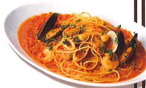
魚介のペスカトーレ