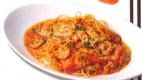
モッツアレラチーズのトマトパスタ