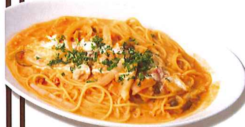
森の恵みのトマトクリーム