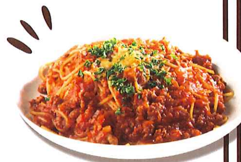
自家製ミートソースボロネーゼ