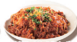
自家製ミニトースポロネーゼ