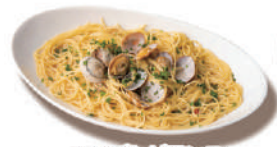
ボンゴレビアンコ