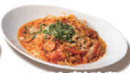
モッツアレラチーズのトマトパスタ ジェノベーゼのせ