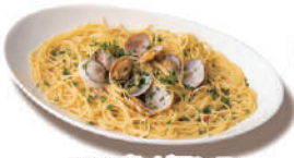
ボンゴレビアンコ