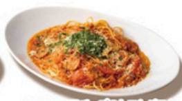
モッツアレラチーズのトマトパスタ ジェノベーゼのせ