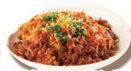
自家製ミートソースボロネーゼ