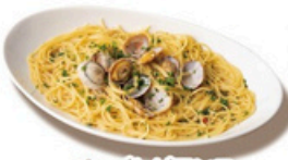
ボンゴレピアンコ